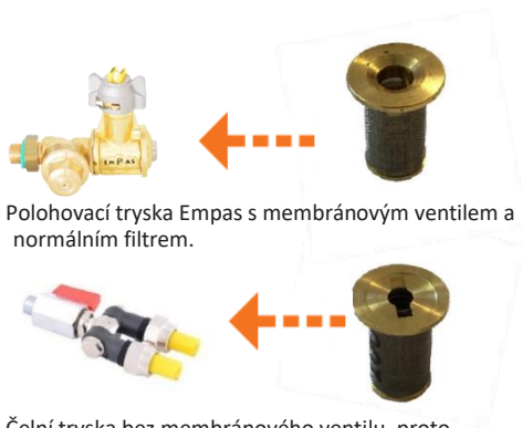
Polohovací tryska Empas s membránovým ventilem a normálním filtrem.