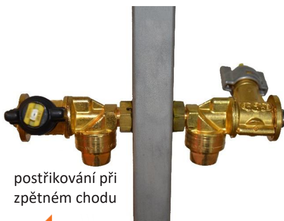
postřikování při zpětném chodu