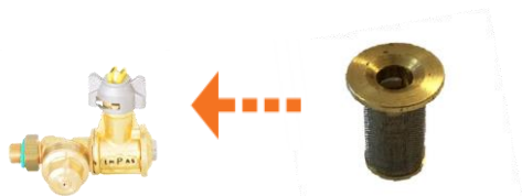
Позиционная форсунка Empas с мембранным клапаном и обычным фильтром.

Чем отличается мембранный клапан позиционной форсунки и самозакрывающийся фильтр фасадной форсунки?