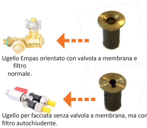
Ugello Empas orientato con valvola a membrana e filtro normale.

Qual è la differenza tra una valvola a membrana di un ugello orientato e un filtro autochiusante di un ugello per facciata?