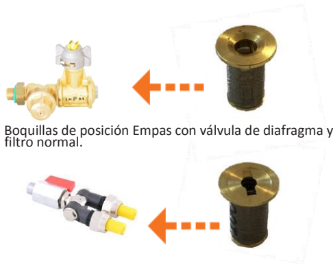
Boquillas de posición Empas con válvula de diafragma y filtro normal.