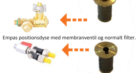
Empas positionsdyse med membranventil og normalt filter.

Hvad er forskellen mellem en membranventil i en positionsdyse og et selvlukkende filter i en facadedyse?